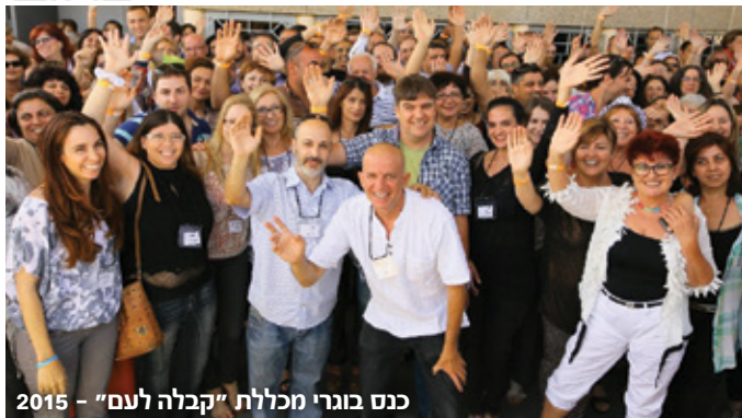
כנס בוגרי מכללת "קבלה לעם" - 2015